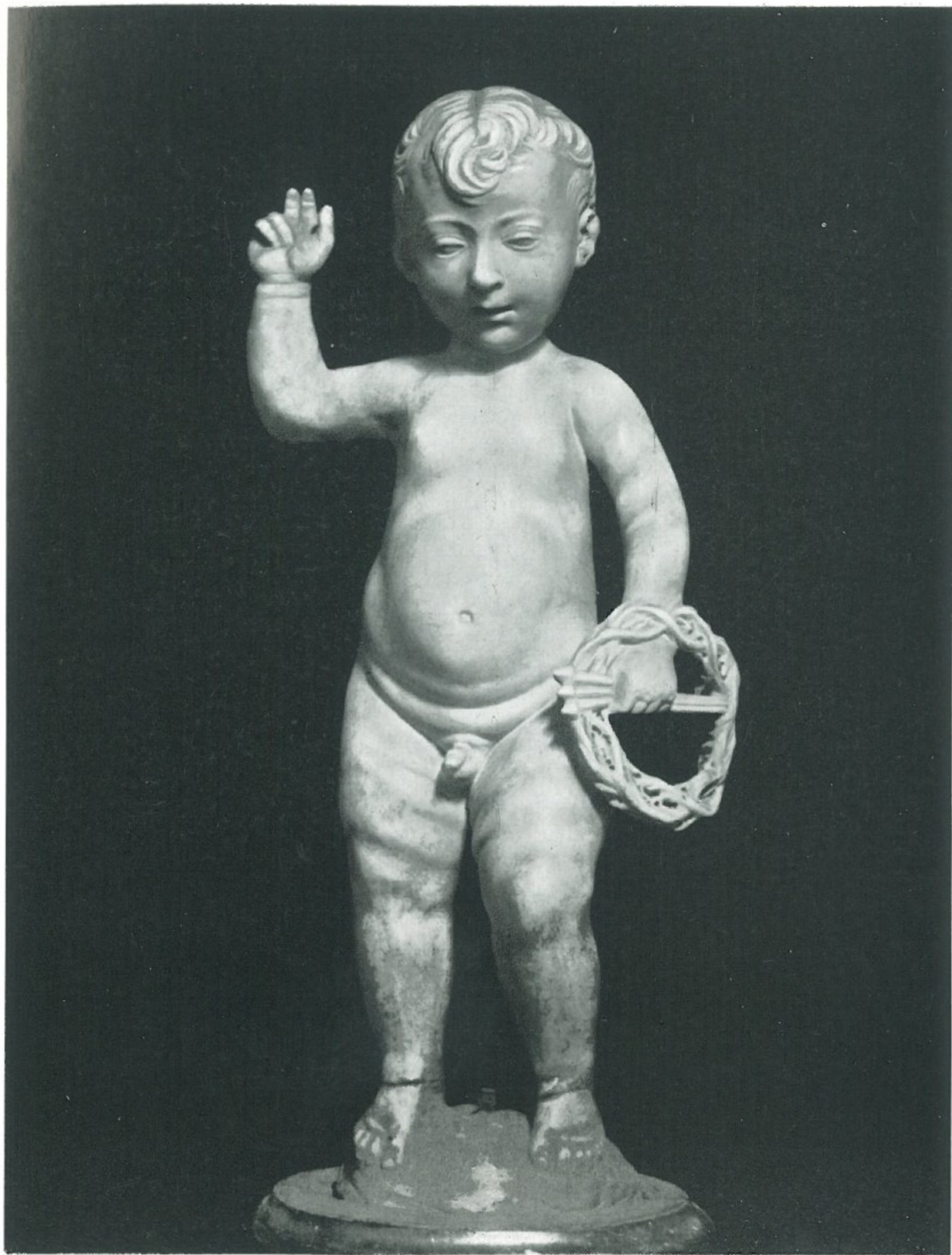
9 - Francesco di Simone Ferrucci - IL BAMBINO GESÙ Cattedrale di S. Stefano