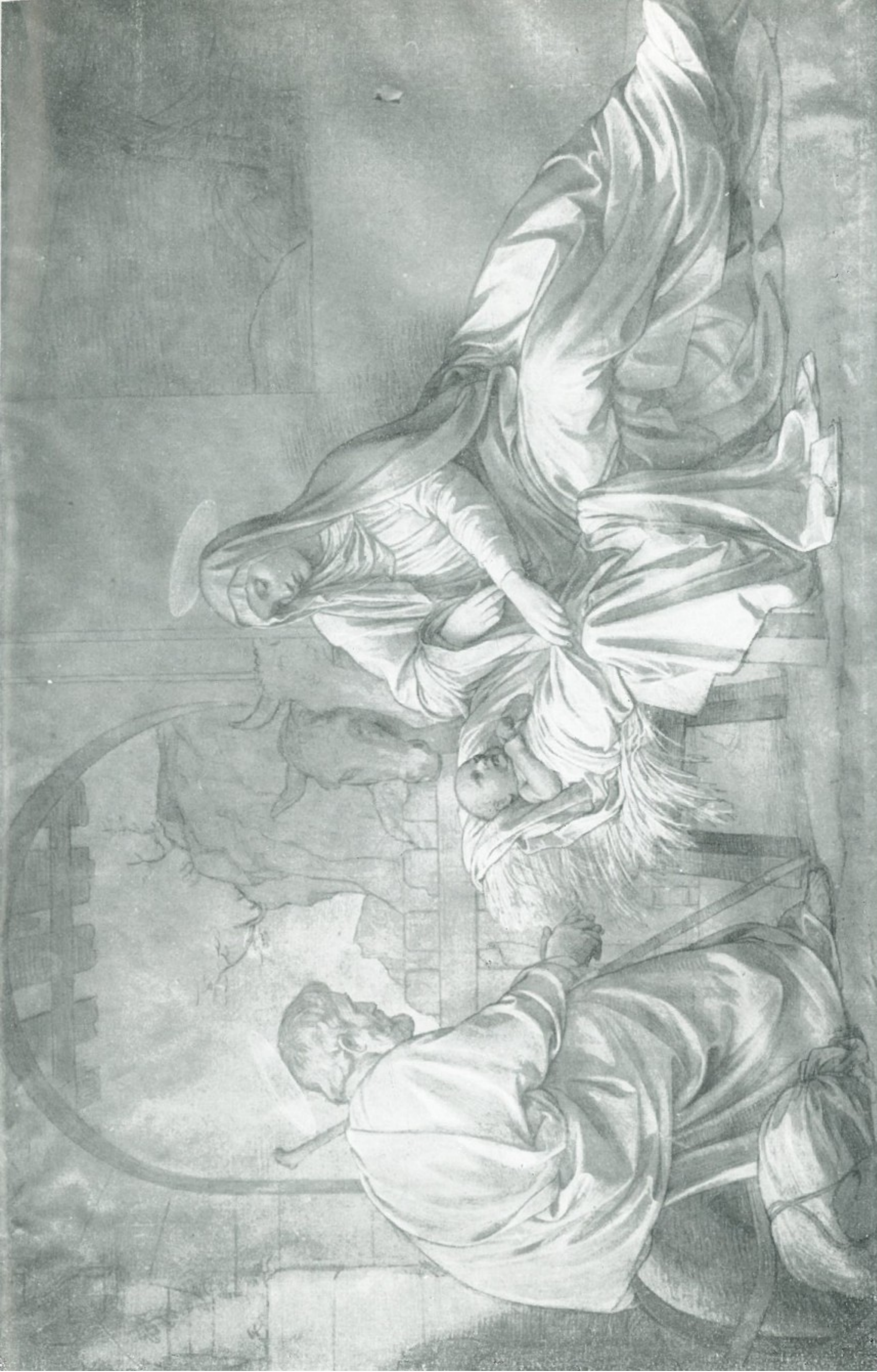
4 - Alessandro Franchi - NATIVITÀ (cartone) Pinacoteca di Palazzo Pretorio