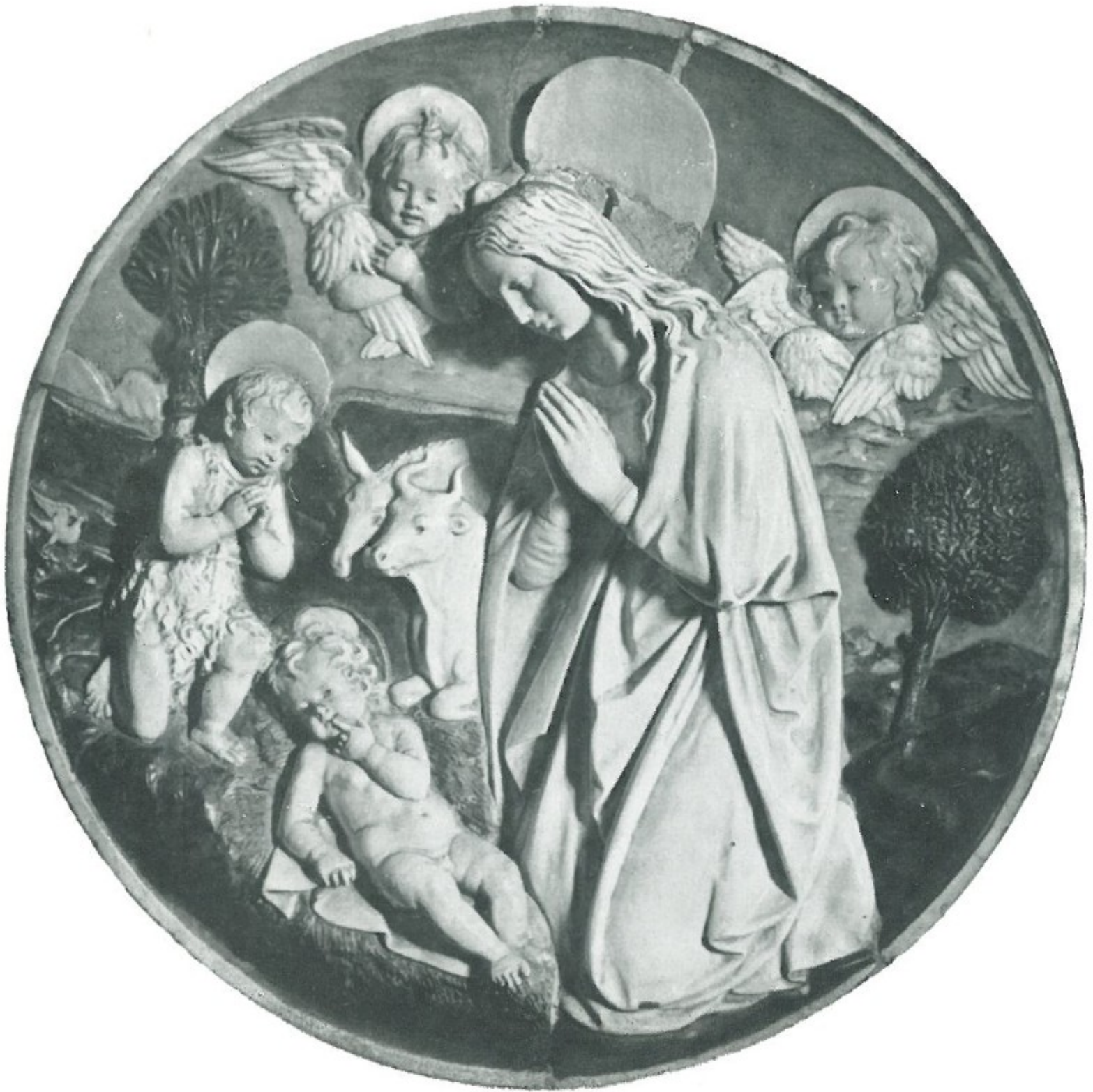
10 - Bottega di Andrea della Robbia - ADORAZIONE DEL BAMBINO Monastero di S. Niccolò