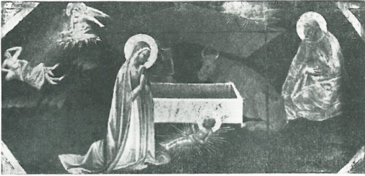
Andrea di Giusto - PRESEPE Pinacoteca di Palazzo Pretorio