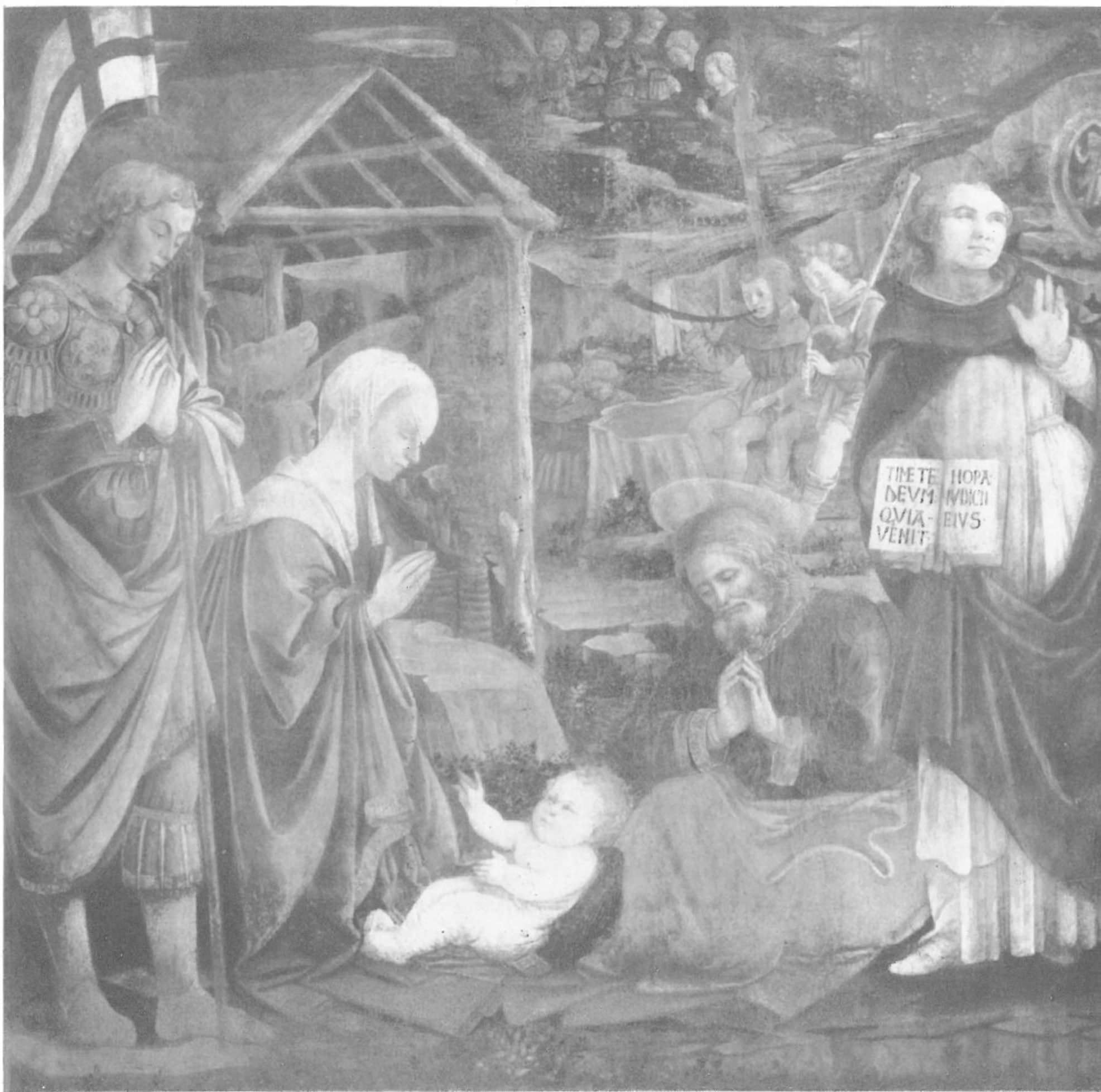
3 - Filippo Lippi e aiuti - PRESEPE coi Ss. Giorgio e Vincenzo Ferrer. Pinacoteca di Palazzo Pretorio