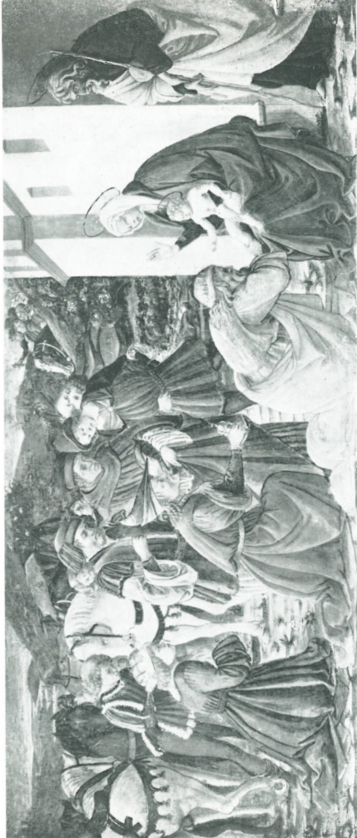
8 - Piero di Lorenzo di Pratese - ADORAZIONE DEI MAGI Pinacoteca di Palazzo Pretorio