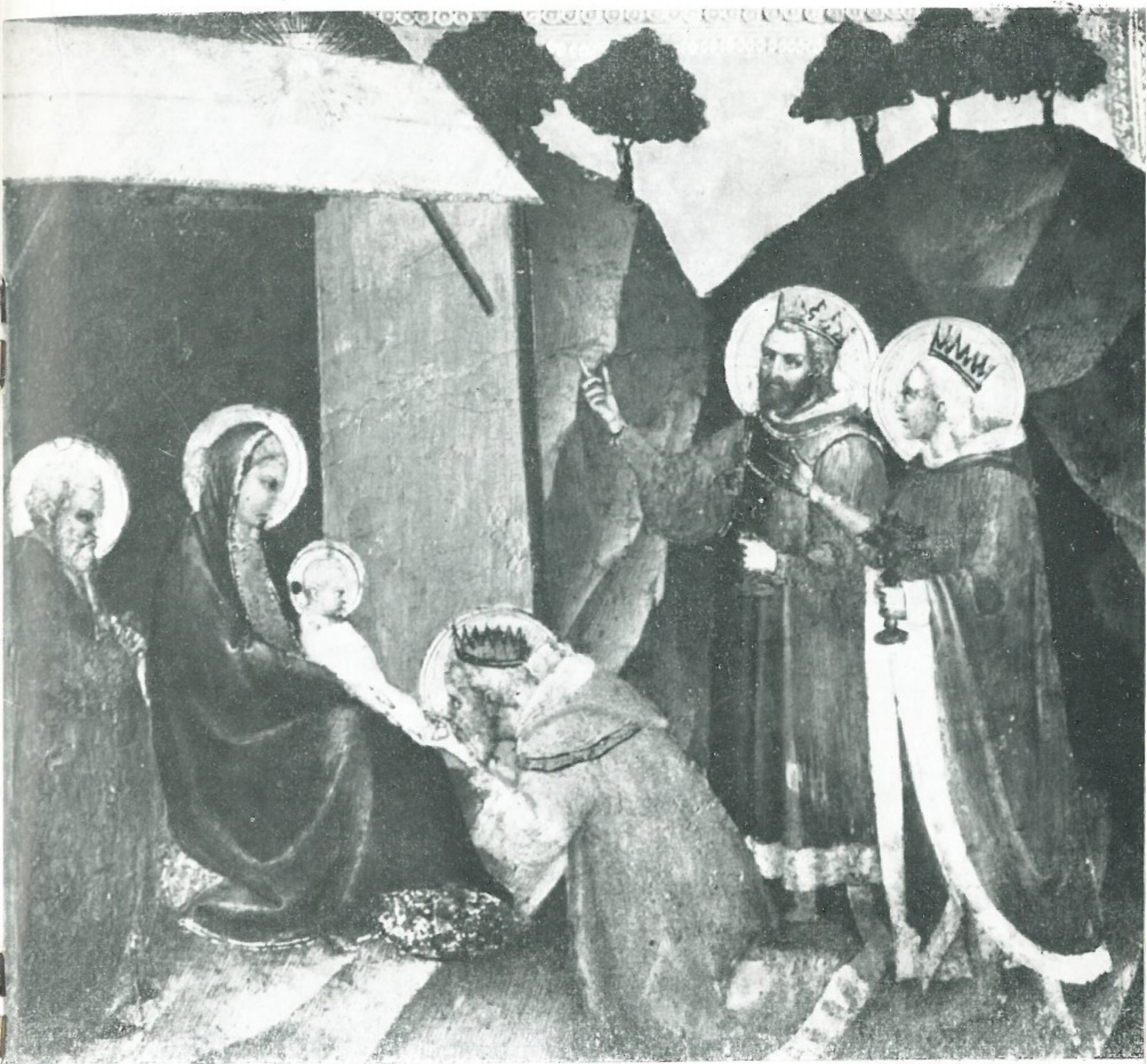
6 - Giovanni da Milano - ADORAZIONE DEI MAGI Pinacoteca di Palazzo Pretorio