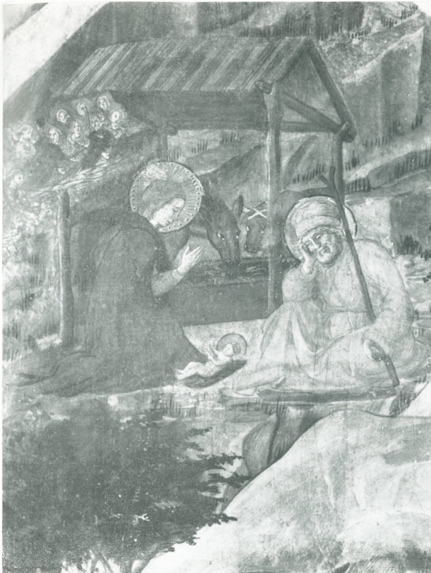
2 - Filippo Lippi - PRESEPE (partic. del Transito di S. Girolamo) Cattedrale di S. Stefano