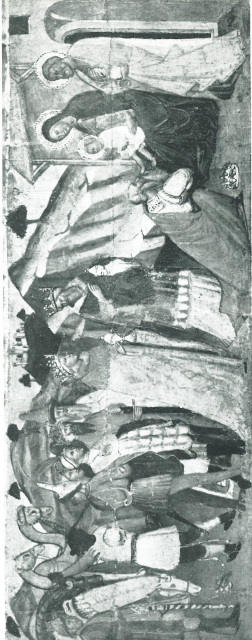
7 - Piero di Miniato - ADORAZIONE DEI MAGI