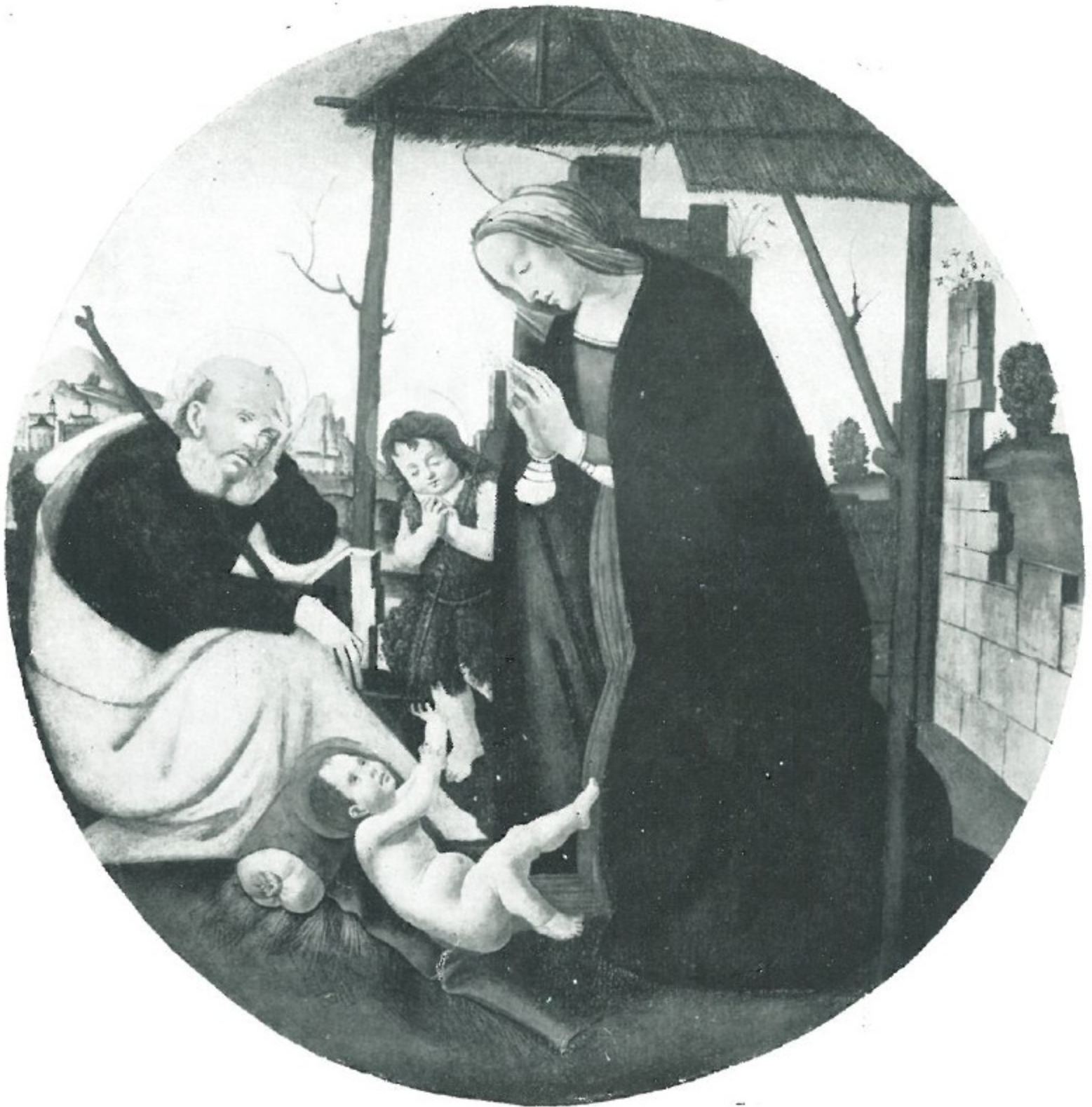
11 - Scuola Botticelliana - NATIVITÀ Chiesa di S. Bartolomeo