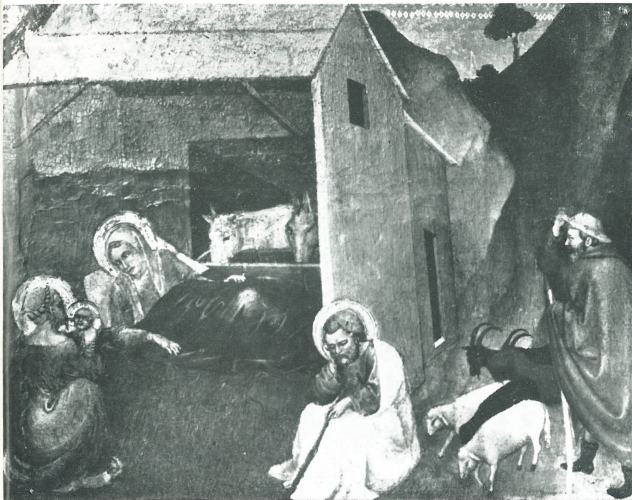
5 - Giovanni da Milano - NATIVITÀ Pinacoteca di Palazzo Pretorio