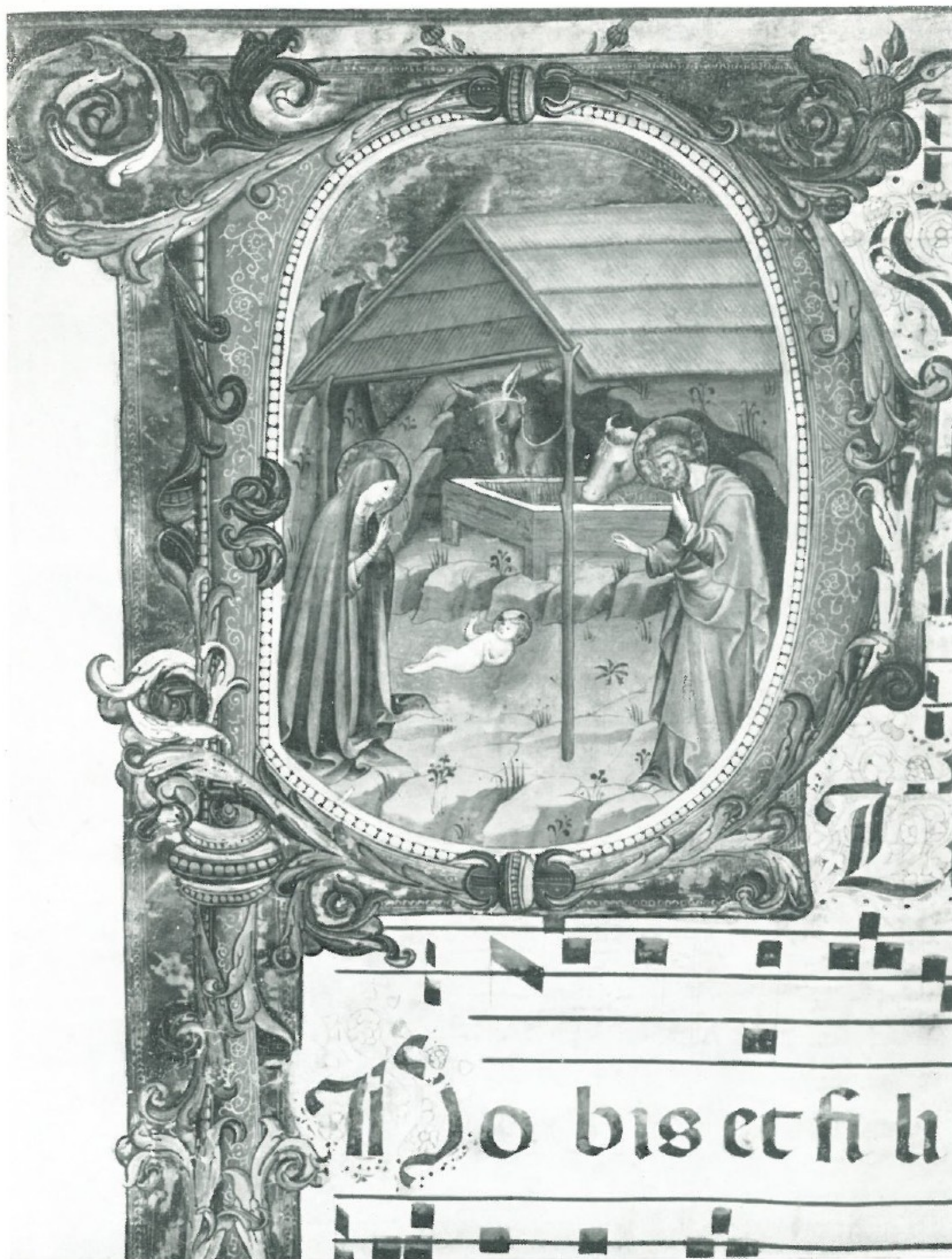
13 - Miniature del 1429 - NATIVITÀ (dal corale «D» della Cattedrale) -- Museo dell'Opera del Duomo