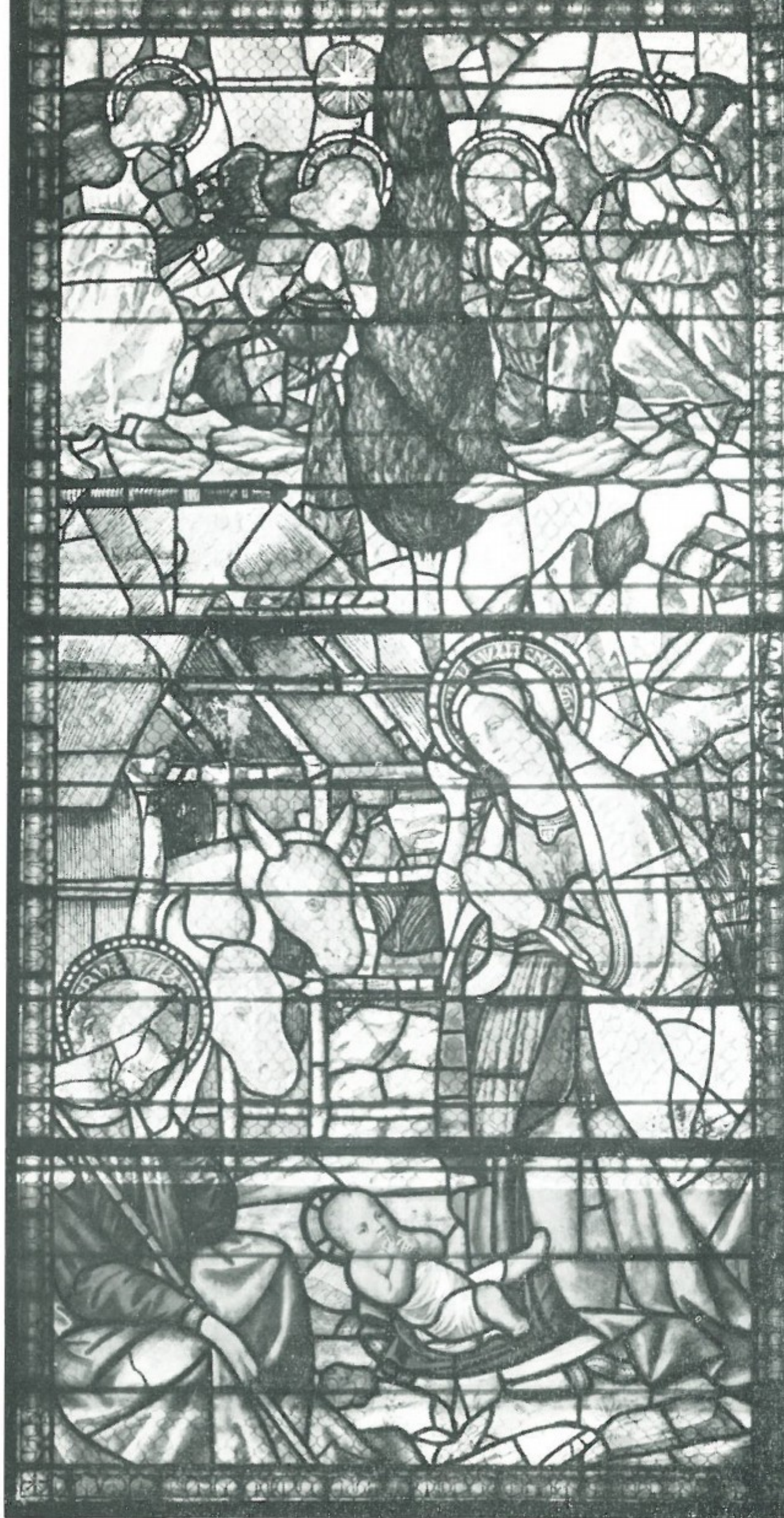
11 - Scuola Ghirlandaiasca - NATIVITÀ (vetrata) Basilica di S. Maria delle Carceri